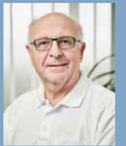
Dr. med. E. Dünninger MVZ Bischberg