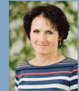
Dr. med. I. Lukas MVZ Bischberg