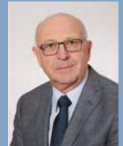
Dr. med. E. Dünninger MVZ Bischberg