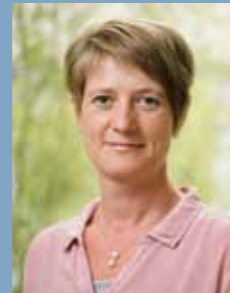
H. Lindacher MVZ Burgebrach