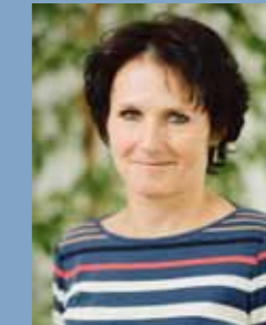
Dr. med. I. Lukas MVZ Bischberg